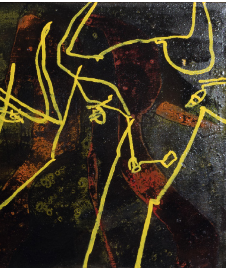
Margarita med hofdame 150 x 70 cm