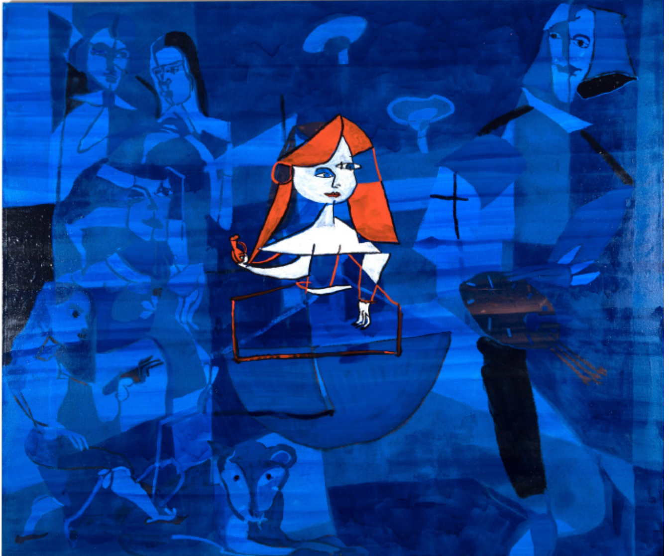
Blå Las Meninas 135 x 160 cm