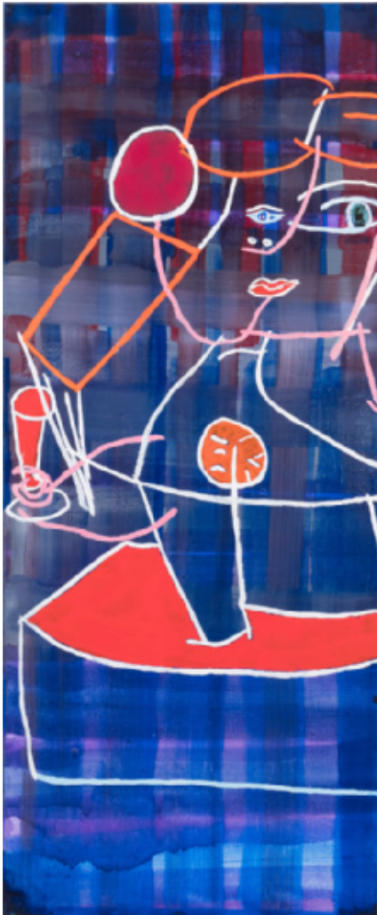
Prinsesse med rød kande 1 130 x 53 cm