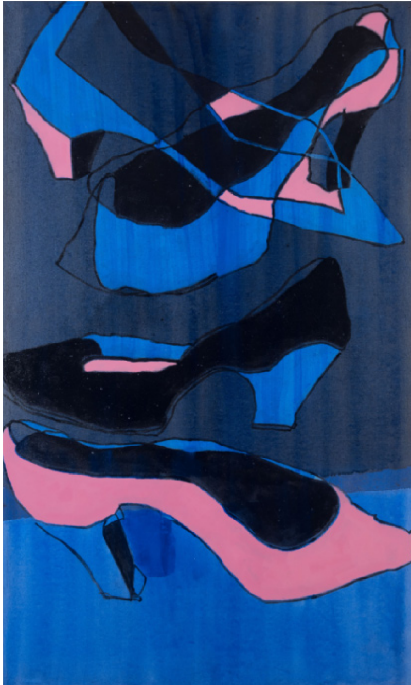
Galas sko 150 x 90 cm