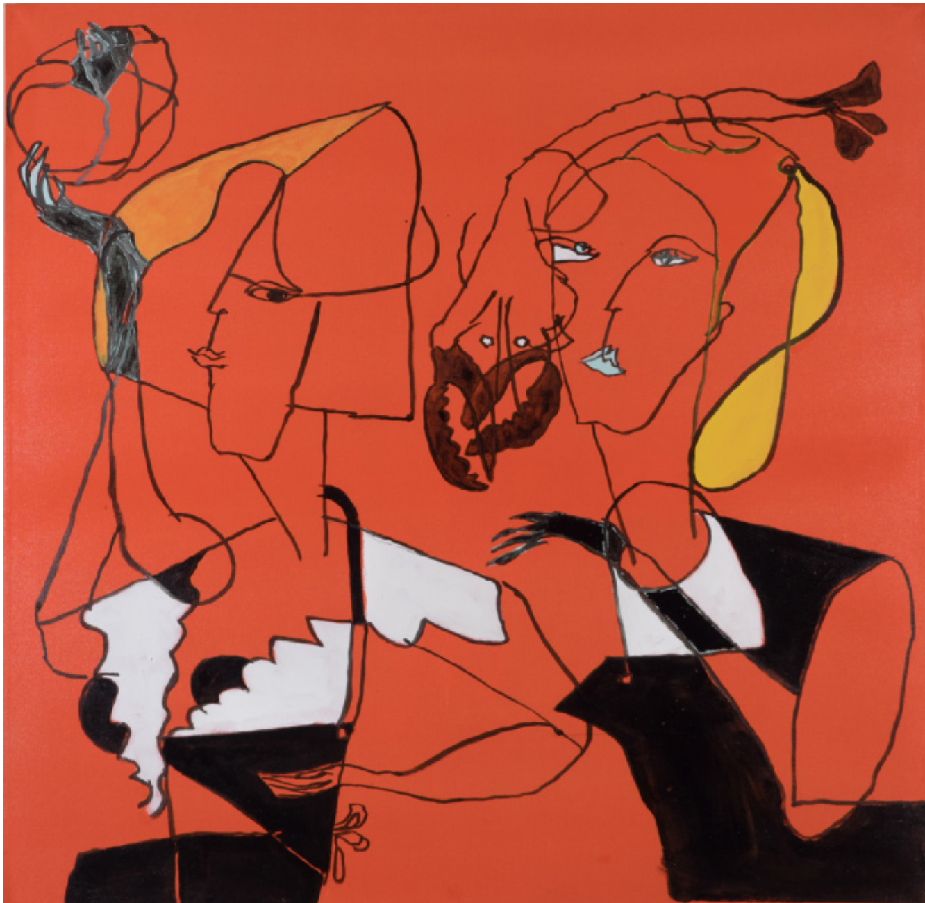
Madmarkedsdame med hummer 128 x 130 cm