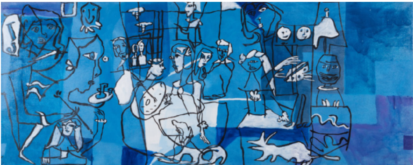
Diego i Barcelona 70 x 175 cm