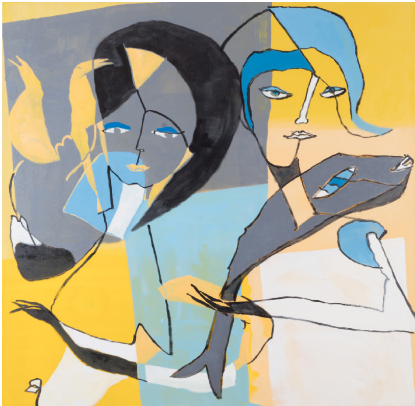
Kylling og fisk 128 x 130 cm