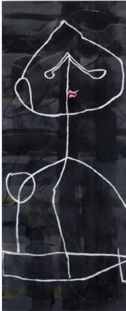
Miró ser på 130 x 53 cm