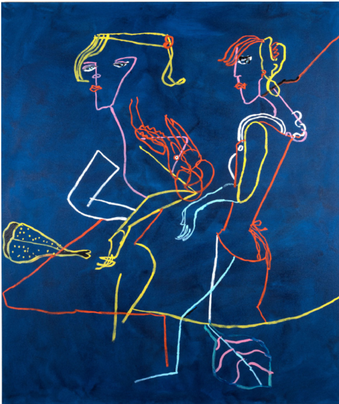
Mercado 160 x 135 cm