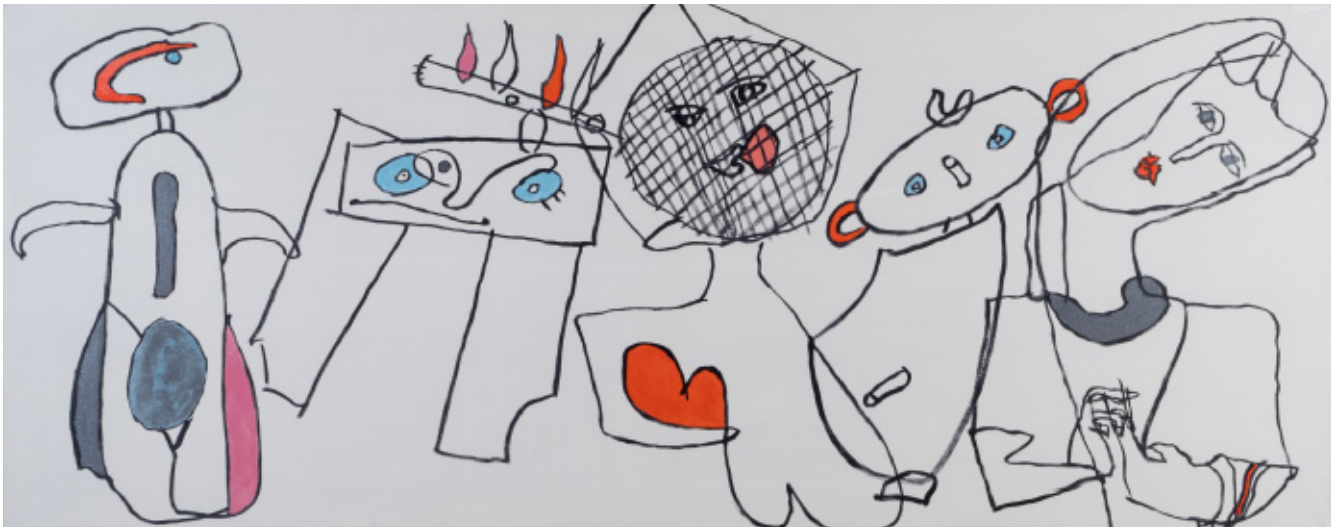
Miró danser 70 x 175 cm