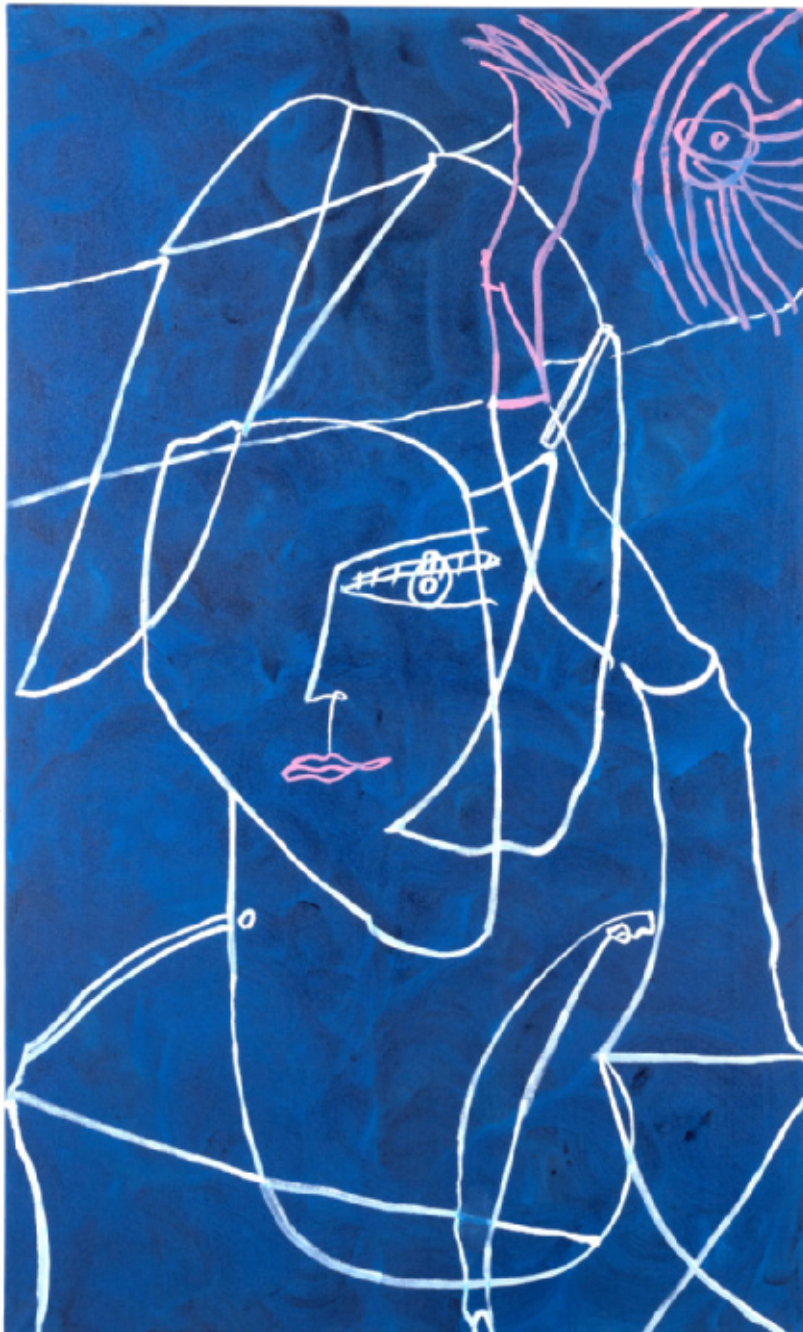
Søstjerne 150 x 90 cm