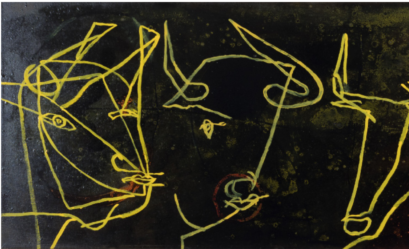
Tyrene i baren 70 x 175 cm