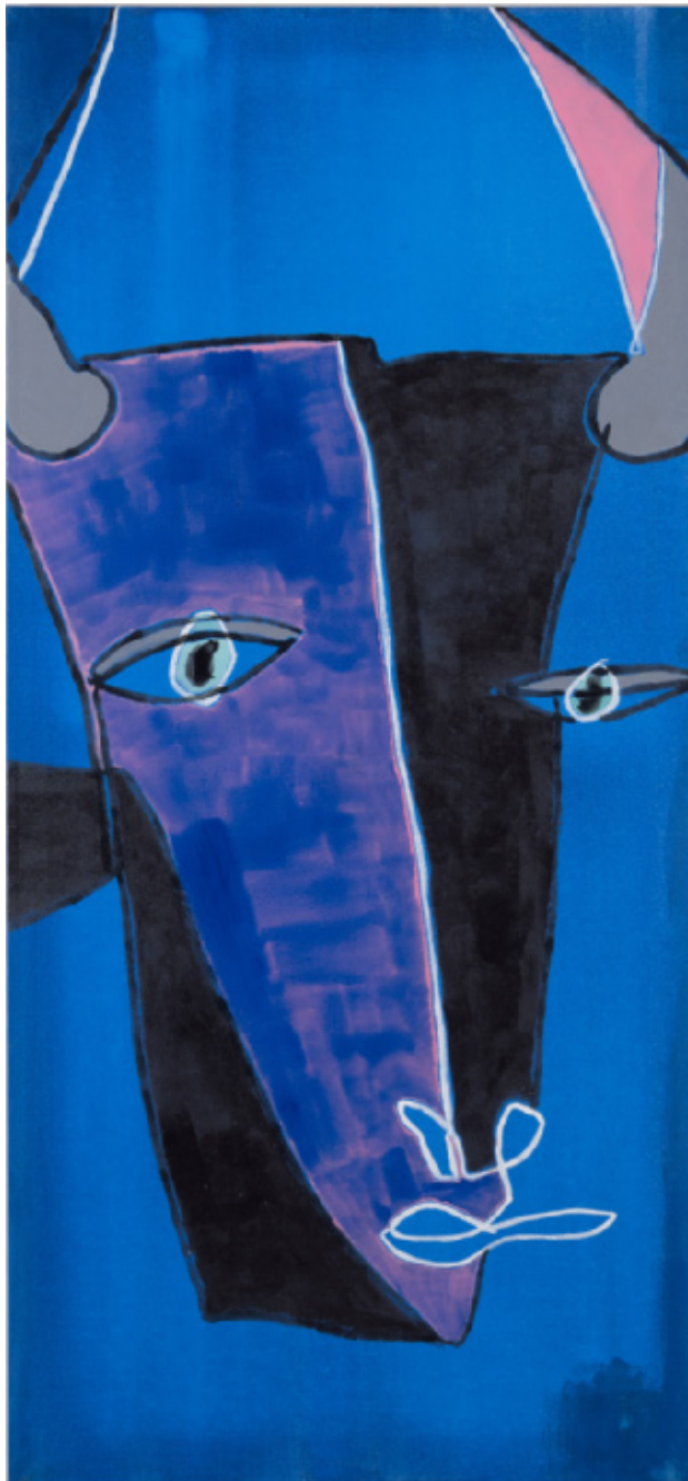
Violeta 150 x 70 cm