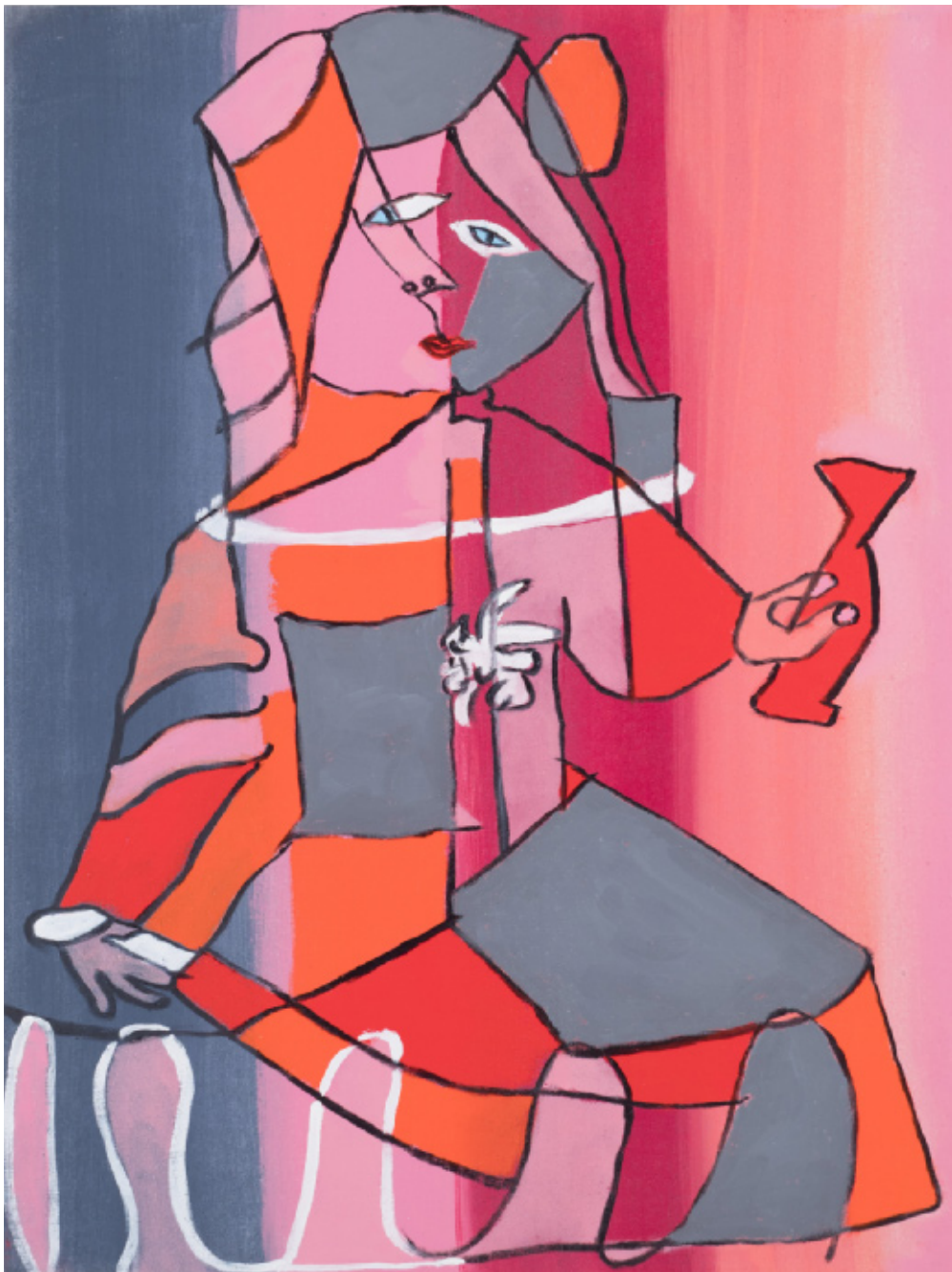
Margarita med kande (1 ud af 5) 80 x 60 cm