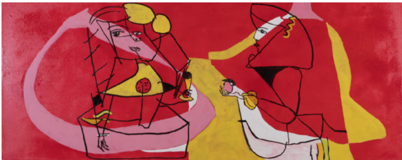
Hofdame med kande 70 x 175 cm