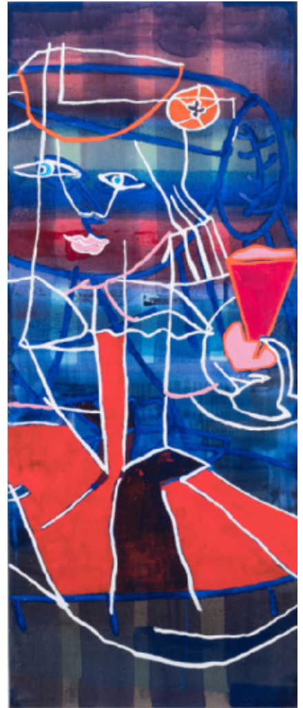
Prinsesse med rød kande 2 130 x 53 cm